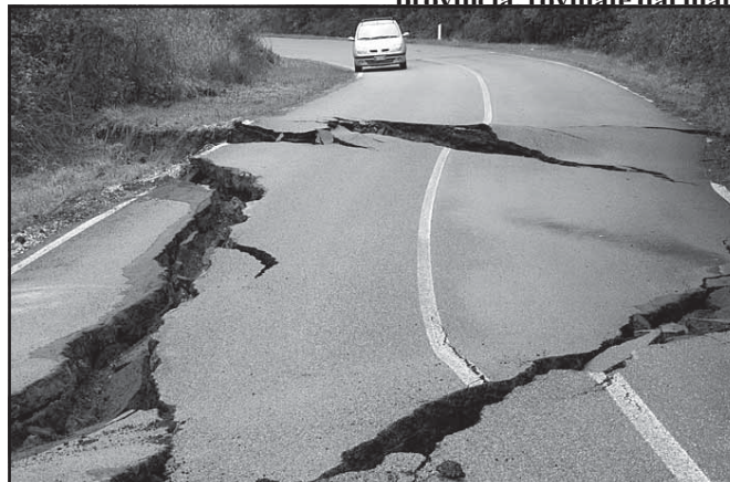
L’ampio smottamento sulla Provinciale tra Canneto e il Forco che da mesi rende la strada inagibile

essere risolto si spera presto: si tratta di creare un fondo ad hoc per intervenire in vari punti delle strade della provincia, rovinate dal mal-