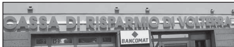
Una filiale della Cassa di Risparmio di Volterra

I lavori di ristrutturazione nell'ex negozio “Quirino” sono ormai ultimati, la filiale di Monteverdi della Cassa di Risparmio di Volterra sarà inaugurata a breve. Anche se i principali servizi bancari venivano già assicurati nell'ufficio messo a disposizione dal Comune al piano terra del municipio, la nuova ampia sede garantirà accoglienza, funzionalità, riservatezza e privacy alle operazioni più delicate. E risponderà anche ad una esigenza molto sentita dai cittadini dopo la chiusura dello sportello bancario in piazza del Convento: il bancomat. Nella sede centrale di Volterra, mentre si prepara l'inaugurazione, si pone in evidenza il significato della nuova filiale, come conferma della vocazione di CRV ad essere “banca del territorio”, un ruolo storico e al tempo stesso sociale in questa parte della Toscana di comuni piccoli ma dal grande