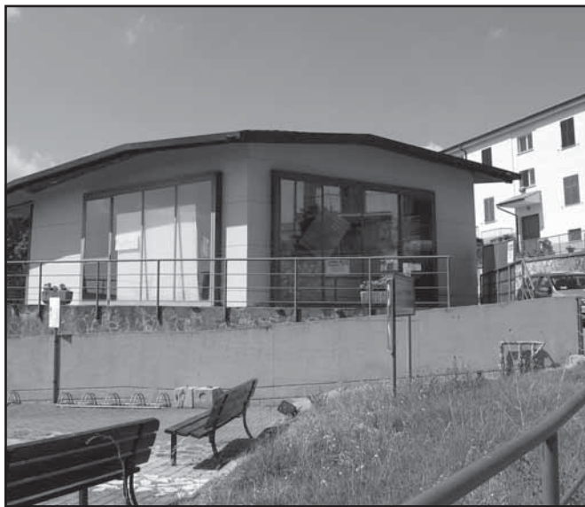
L'ufficio turistico di piazza San Rocco

Apertura forzatamente ridotta durante l'estate. Come altrove, servirebbe un sostegno da parte degli operatori economici locali